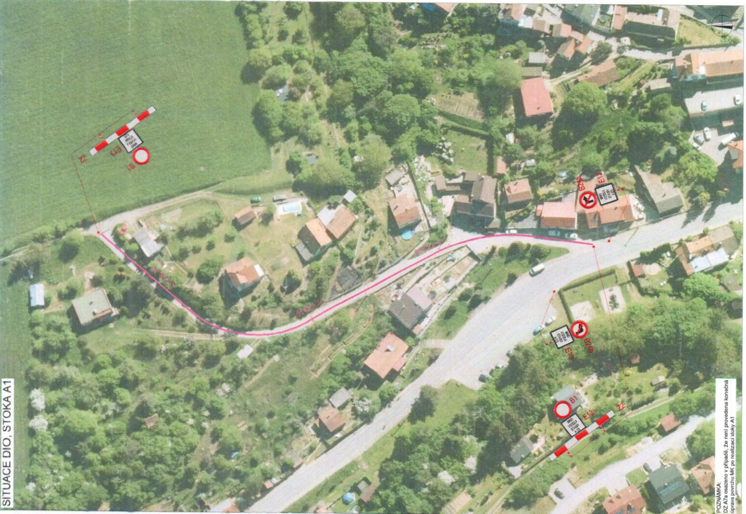
SITUACE DIO, STOKA A1

POZNÁMKA: DZ A1 je osazeno v případě, že není provedena konečná úprava povrchu MK po realizaci stoky A1