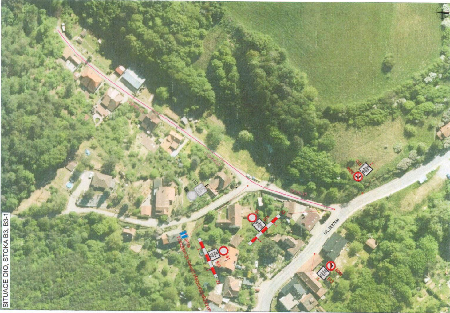
SITUACE DIO. STOKA B3, B3-1